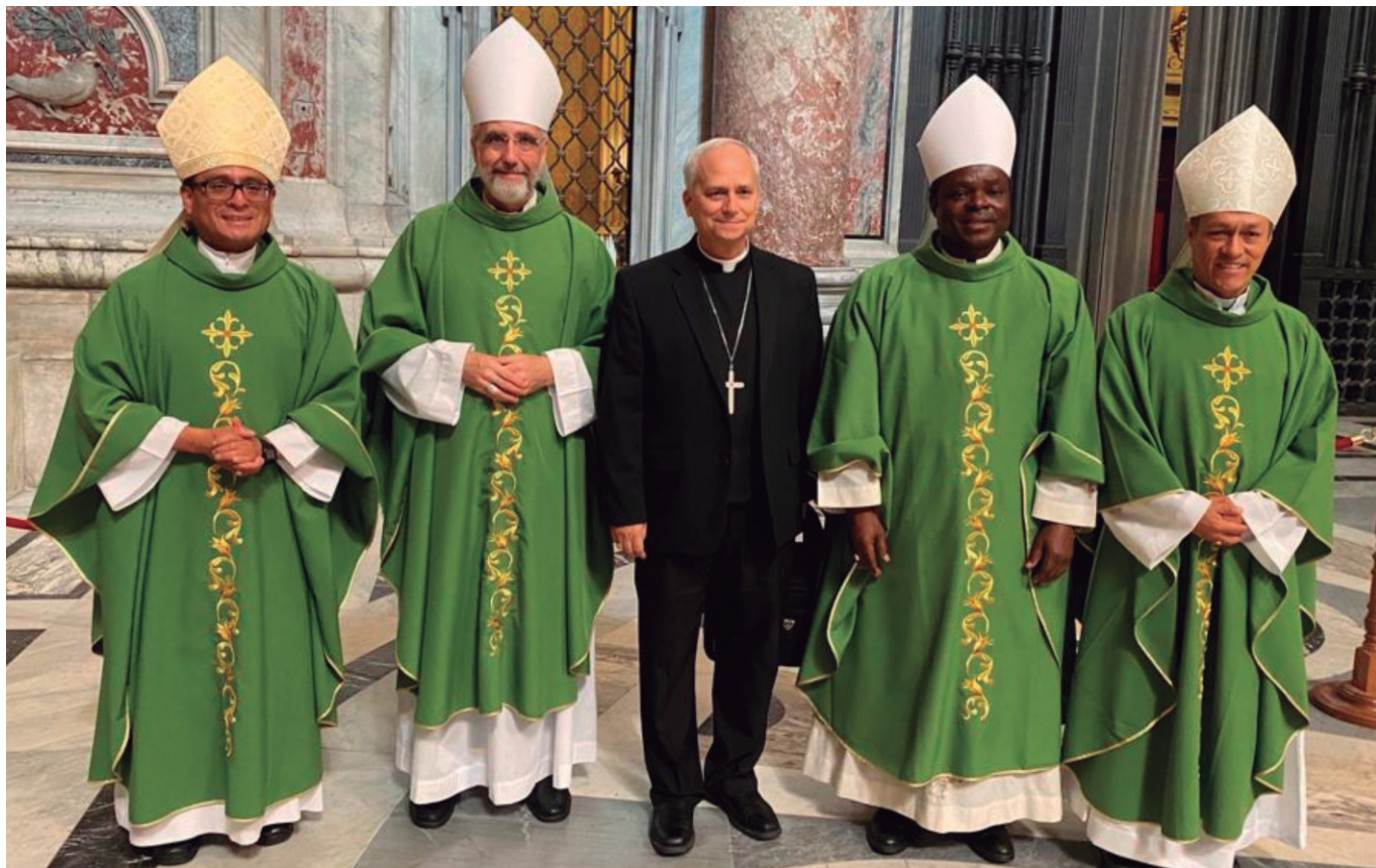
Obispos Agustinos participantes del Sínodo de la Sinodalidad

5. Estamos viviendo el proceso de la Sinodalidad en la Iglesia y usted tiene gran participación en este proceso, como presidente de la Comisión Episcopal para el Sínodo en el Perú, como miembro participante de la Asamblea Eclesial de América Latina y el Caribe, y como participante de la primera sesión del Sínodo de los Obispos en Roma, en octubre de 2023 ¿Qué ha significado para usted ser parte de este proceso y qué importancia tiene para la Iglesia en los días actuales ser invitado a vivir el camino Sinodal?