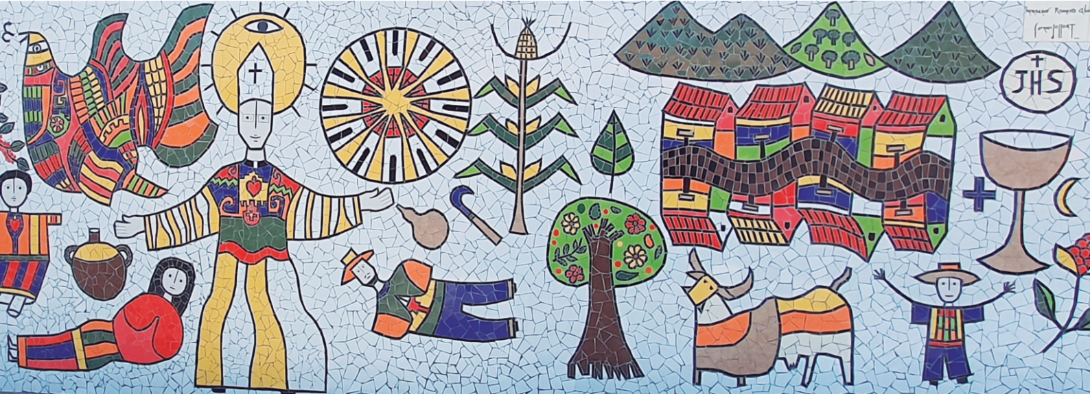
Panel Artístico - Hospital Divina Providencia - San Salvador Homenaje a San Óscar Arnulfo Romero

Organización de los Agustinos de Latinoamérica (OALA)