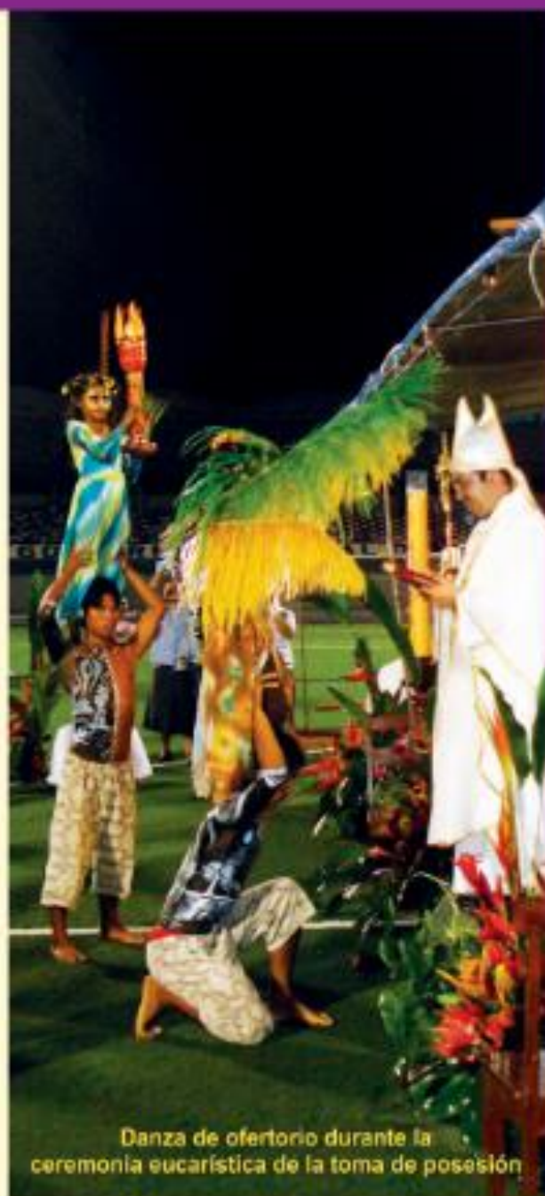
Danza de ofertorio durante la ceremonia eucarística de la toma de posesión

Tras despojarse de las vestiduras eclesiásticas, los obispos acompañados por el P.