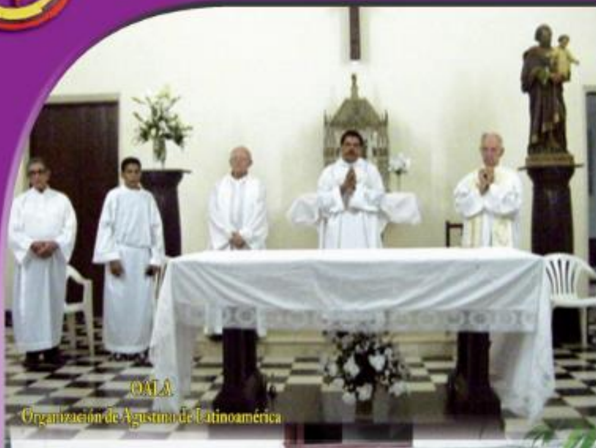
OALA Organización de Agustinos de Latinoamérica