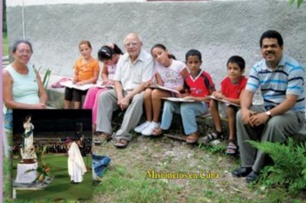
Misioneros en Cuba